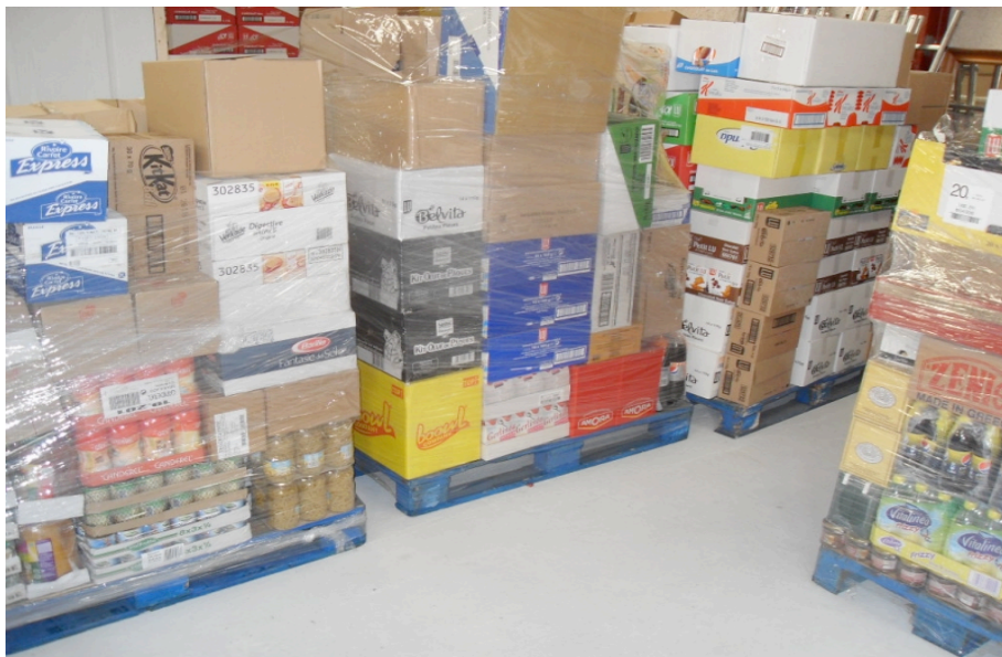
Palette de produits

- Aspects négatifs : Le travail est TRES répétitif et ennuyeux, la plupart du temps on ne fait qu'attendre les clients, et cela même parfois, tout une journée. Les horaires sont assez contraignants, le fait de finir à 19h nous empêche de pratiquer un loisir pendant nos temps libres. La clientèle est parfois très énervante, certaines personnes parlent pendant très longtemps, d'autres posent toujours les même questions, et d'autres expriment constamment leur insatisfaction. Il y a beaucoup de responsabilités, surtout s'il n'y a qu'une seule personne qui s'occupe du magasin .